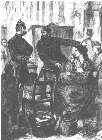
Εξομησιμογόνημας εκτετατόν στη Γρομανία, 1872.