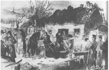
Έξωση Ιρλανδών χωρικών από τη γη που καλλιεργούσαν, 19ος αι.