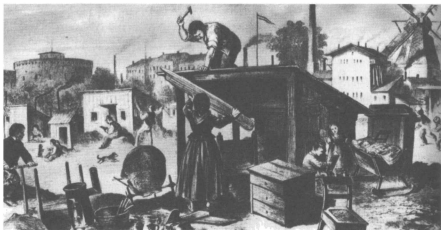
Καλίβες φτωχών στο Βερολίνο, 1872.